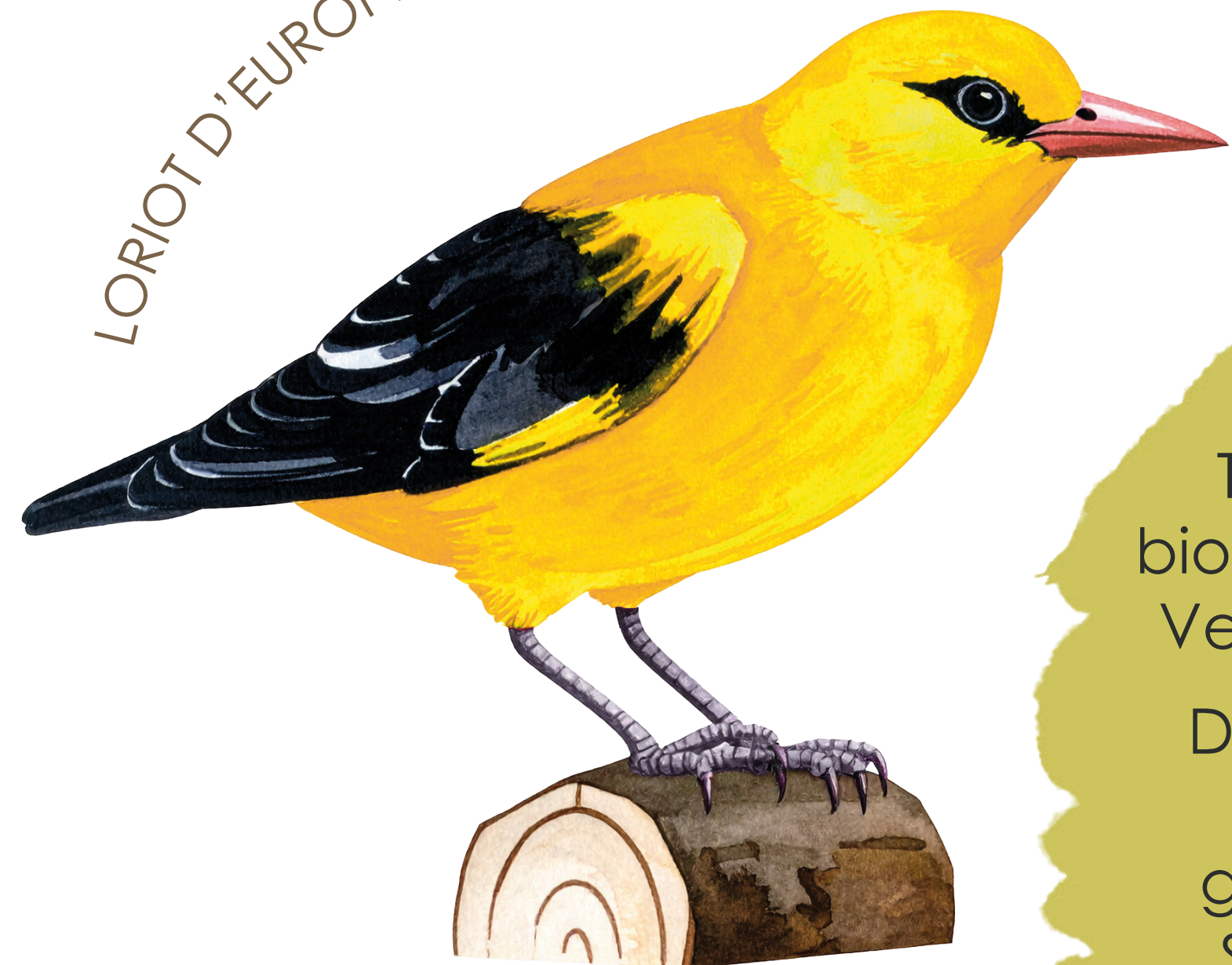
LORIOT D'EUROPE (Oriolus Oriolus)